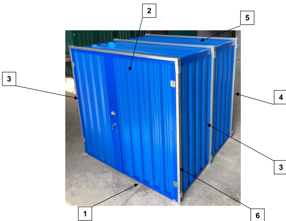
Рис.1 Внешний вид контейнера

* Внешний вид может отличаться в зависимости от модификации.